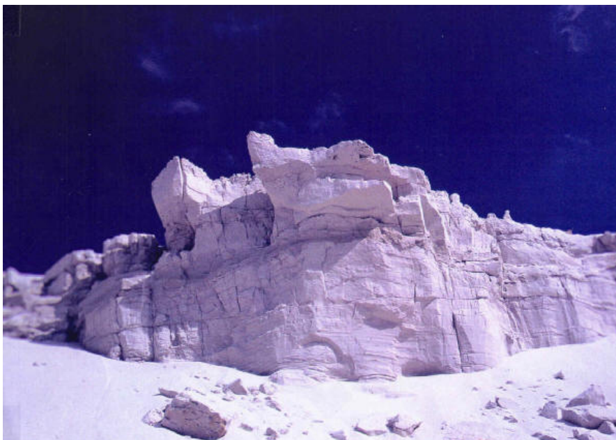
Zilverzand in groeve Beaujean

Nabij Heerlen worden zanden met een extreem hoog kwartsgehalte (99,9%) gewonnen die lithostratigrafisch onder de kleien van Brunssum zijn gelegen. De zanden zijn volledig uitgeoogd, mogelijk door grondwater afkomstig uit de veen- (bruinkool) lagen die ontstaan zijn boven deze zandpakketten. Tussen Heerlen en Brunssum is er een aantal groeven.